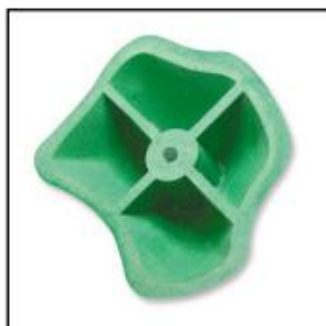
Skořepinový chyt Hollow hold